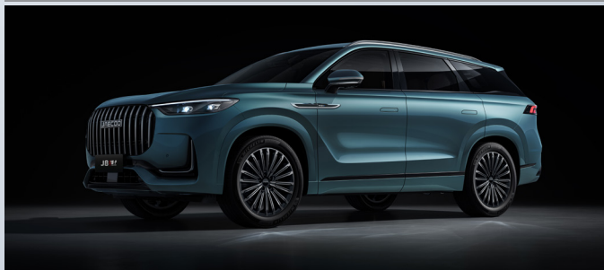
JAECOO 8 SHS-P | OLIVE GRAY