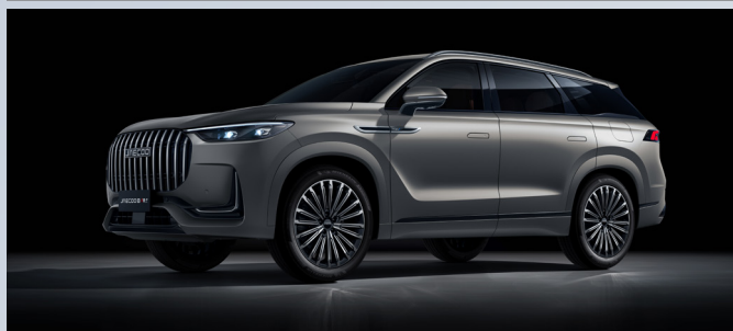
JAECOO 8 SHS-P | MATTE GRAY

Iridium Lustre Silver & Black Roof: €1350