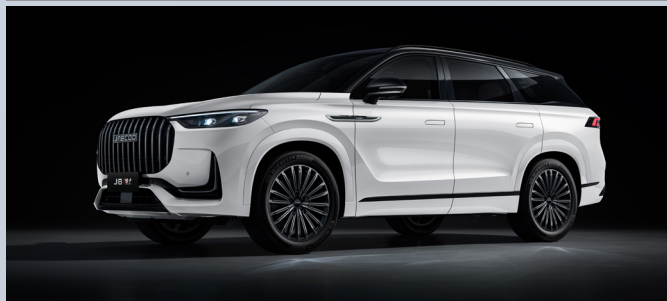
JAECOO 8 SHS-P | KHAKE WHITE BLACK ROOF