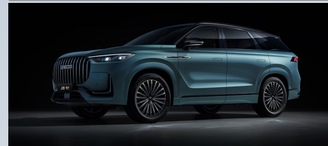
JAECOO 8 SHS-P | OLIVE GRAY BLACK ROOF