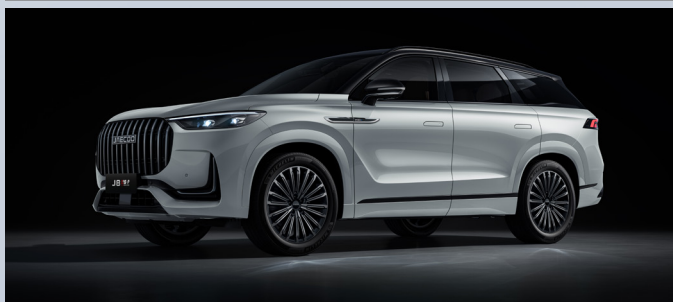
JAECOO 8 SHS-P | IRIDIUM LUSTRE SILVER BLACK ROOF

Iridium Lustre Silver & Black Roof: €1350