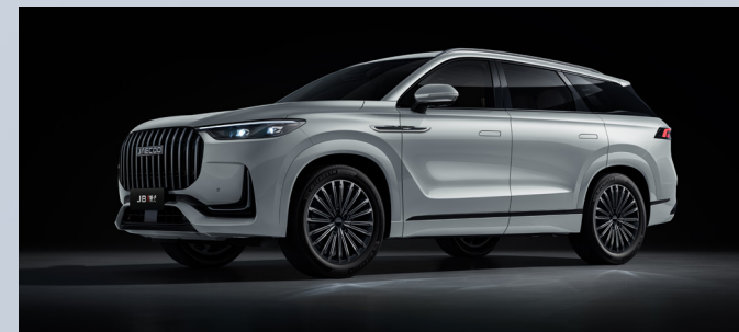
JAECOO 8 SHS-P | IRIDIUM LUSTRE SILVER