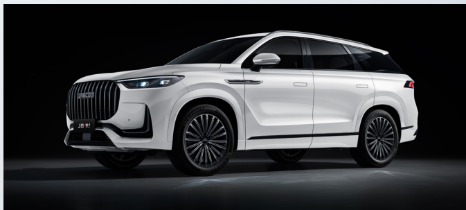
JAECOO 8 SHS-P | KHAKE WHITE

Standaard ingebepen: Khaki white: €0,00 Zwart interieur met lichtgrijze hemelbekleding: €0,00