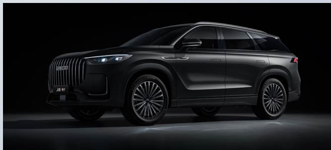
JAECOO 8 SHS-P | CARBON CRYSTAL BLACK

Standaard ingebepen: Khaki white: €0,00 Zwart interieur met lichtgrijze hemelbekleding: €0,00